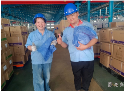
图为甜甜圈家人前往车间送工服和裤子

这是多么暖人心的时刻，一件小小的裤子，一个小小的举动，瞬间拉近了家人们之间的距离。正是这一件件的小事和家人们的互帮互助，才让这个集体的家人们距离慢慢变得更短、心渐渐靠拢。我们也有理由相信，心中相互惦记着彼此的这样一个团队，未来会更团结一致，一起同心向前！