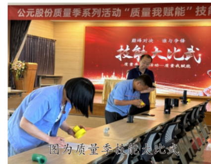
图为质量季技能比武