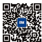
公元管道官方微信