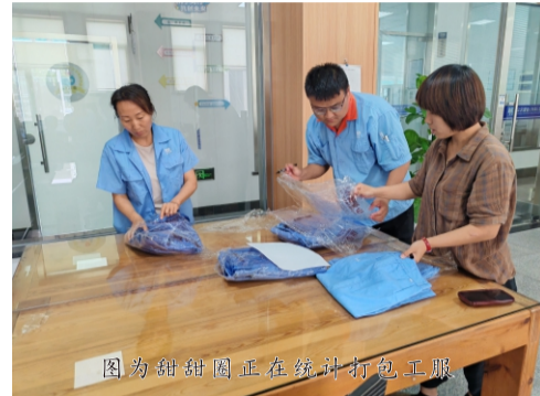
图为甜甜圈正在统计打包工服