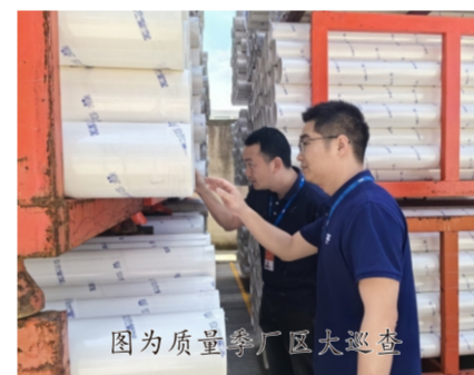
图为质量季厂区大检查