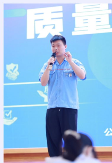
隰西注塑B1 加热圈 胡鑫