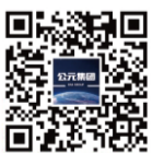
公元集团官方微信