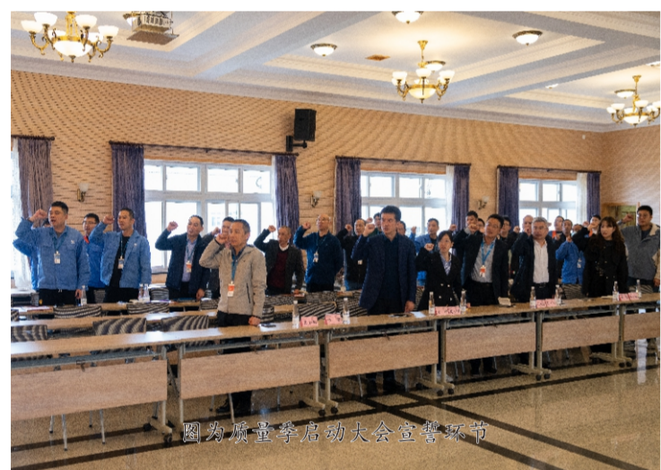
图为质量季启动大会宣誓环节

线，同时也要充分考虑产品的应用场景；二是质量责任意识要宣贯到全员，在追求质量100的过程中，要加强一线员工的质量意识，让员工听得进去、能够理解；三是质量要按照大的方向去看，从小事入手，层层落实，这样才能保证产品质量。他希望大家能以本次质量季活动为契机，不断地降低客诉、客怨的质量问题，实现“质量100，满意100”的目标。