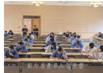
图为质量季知识竞赛