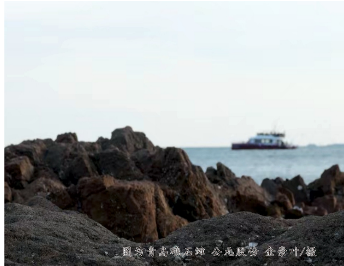
图为青岛礁石滩 公元股份 金紫叶/摄

在这片礁石的水洼里，我们以手为网，捕鱼摸虾。耳边似乎再次响起童年岁月里的那些欢歌笑语，心中那