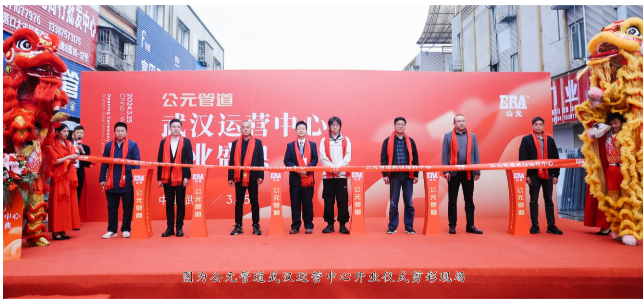
图为公元管道武汉运营中心开业仪式剪彩现场

据悉，武汉运营中心公元4.0超级品牌体验空间是公元全国首家在公元品牌店4.0版本基础上升级呈现的集企业展示、产品施工、品牌形象、体验互动、商务办公等功能为一体的品牌空间，既保持了形象风格的连贯性，又提升了产品应用的直观感，地下管廊模拟仓、家庭厨卫实景厅、建筑排水方案墙、空间供热系统墙等一系列场景透视，让消费者身临其境，感受公元的匠心之美和科技之力。