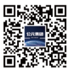
公元集团官方微信