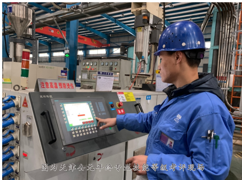
图为天津公元年终专业技能等级考评现场

此次业务技能的比拼，既增强了技能人才查漏补缺的意识，又通过细化考核内容，实现了“以考核促学习、以考核促提升、以考核促落实”的作用，为天津公元2024年质效双升提供了强有力保障。