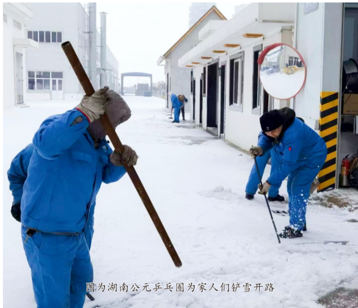
图为湖南公元乒乓圈为家人们铲雪开路