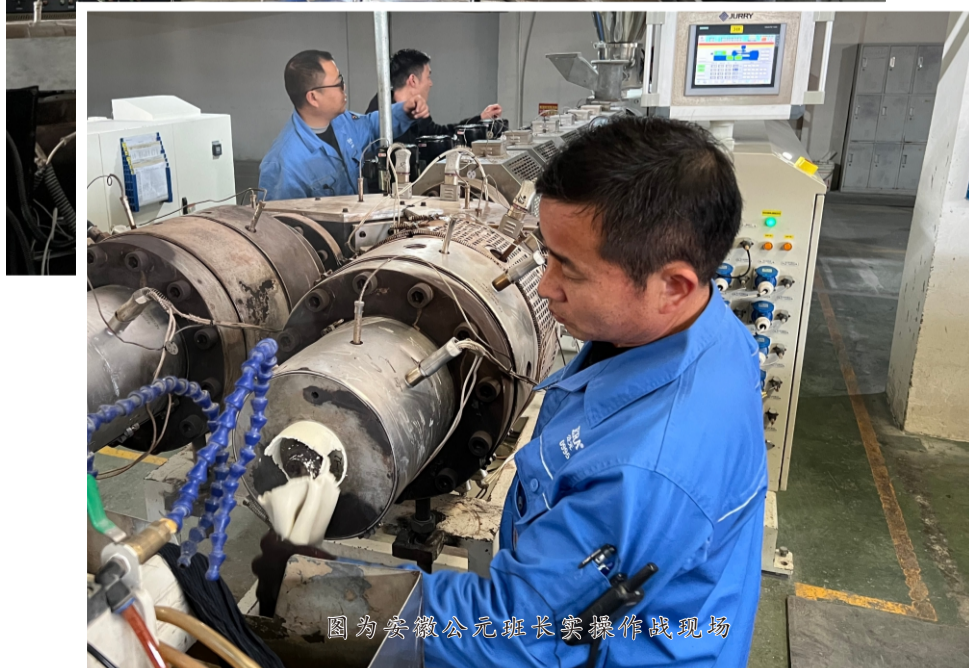
图为安徽公元班长实操作战现场