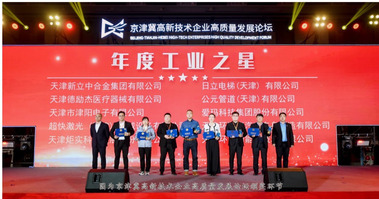
图为京津冀高新技术企业高质量发展论坛颁奖环节

除了获奖荣誉，论坛上还发布了2023天津数字技术品牌企业和数字产品品牌企业，进一步展示了地区内高新技术企业的创新成果。此外，论坛还见证了多项重要的合作签约，包括京津冀三地高新技术领域行业协会的战略合作和重点项目的签约，为三地高新技术企业提供了新的合作机遇和发展平台。