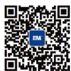
公元管道官方微信