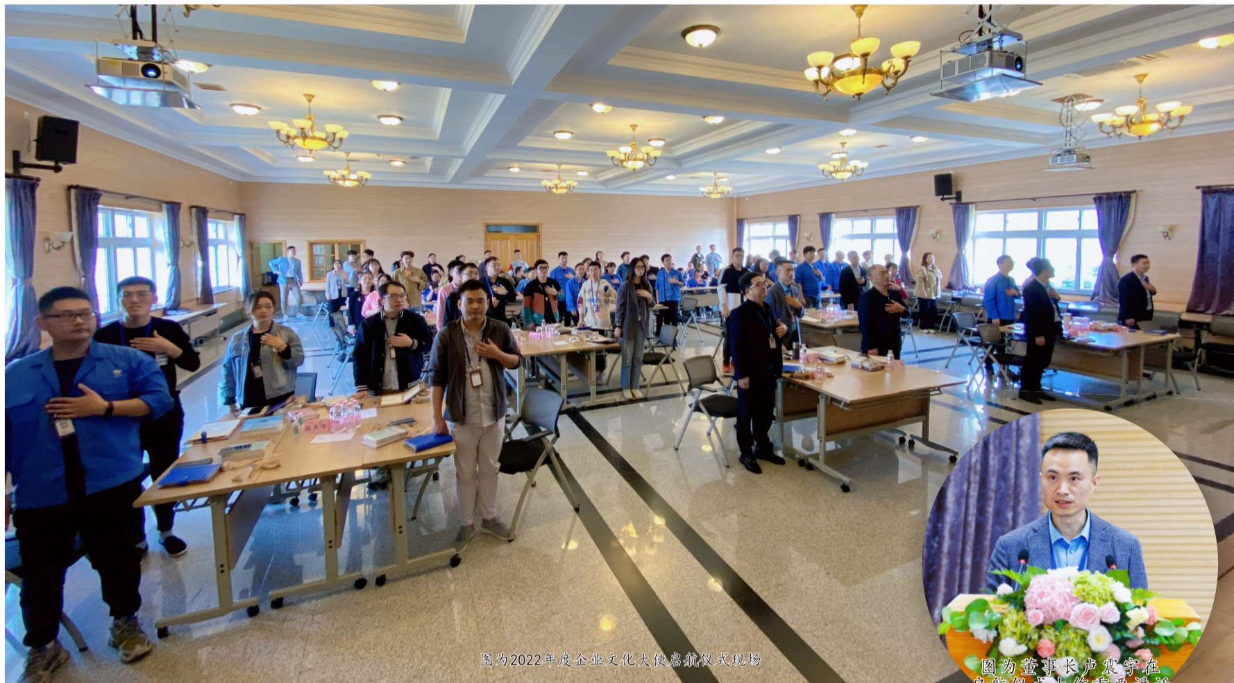
图为2022年度企业文化大使启航仪式现场