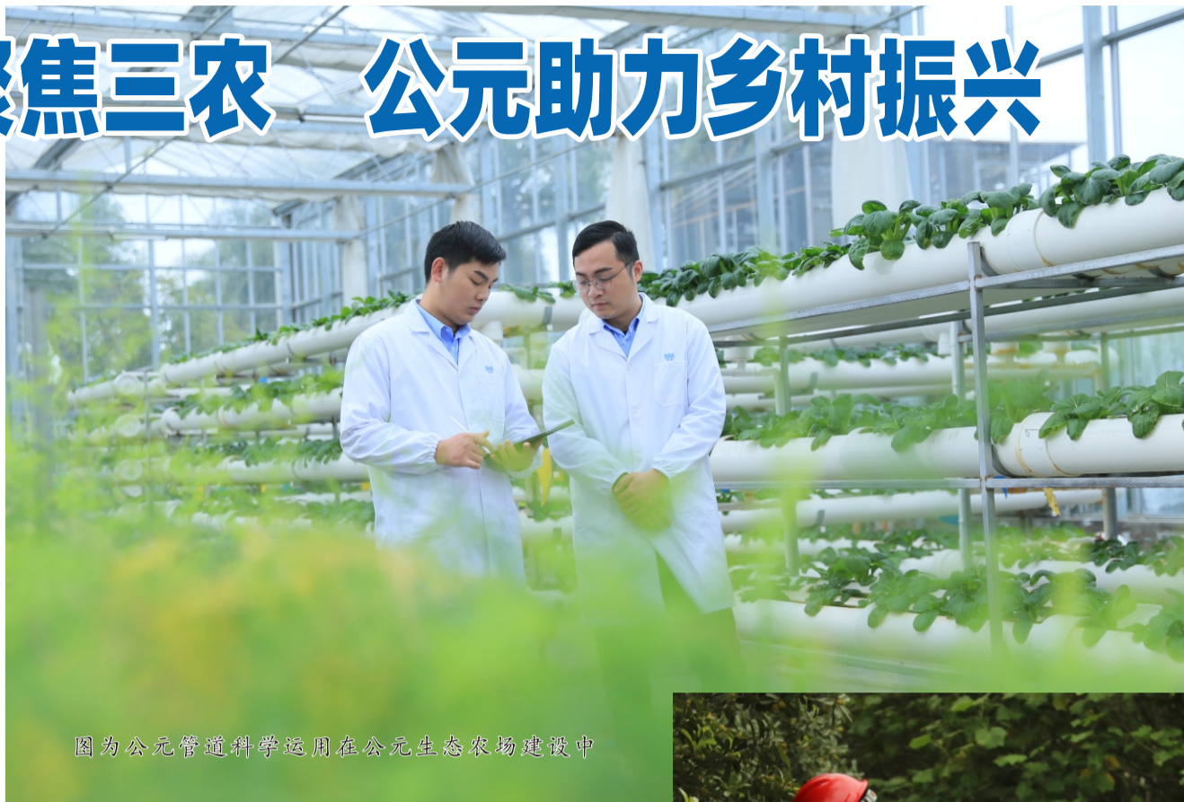
图为公元管道科学运用在公元生态农场建设中

此外，为响应国民对无公害绿色蔬菜的强烈呼声，公元也给出了自己的方案。公元PVC无铅管采用绿色无铅材质打造，性能优良，健康环保，可以广泛运用于无土栽培、温室栽培等领域，为生态农业高质量绿色发展保驾护航。