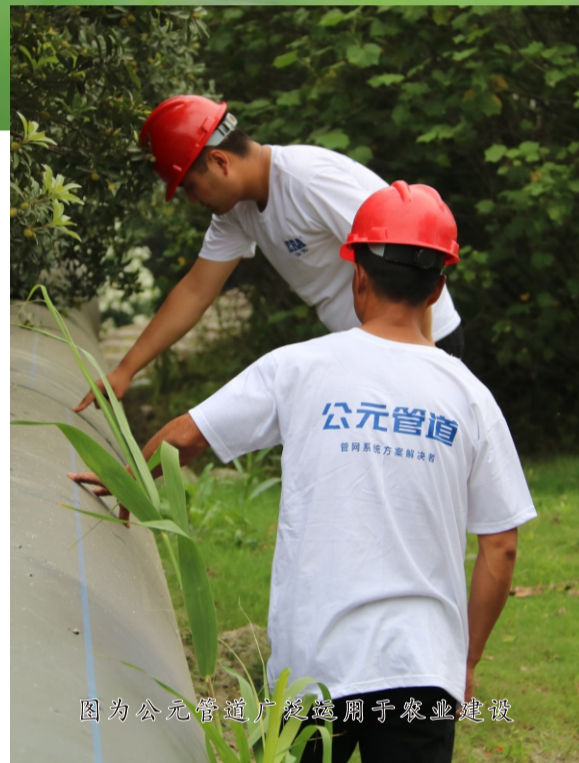
图为公元管道广泛运用于农业建设

铁肩担道义，匠心筑好管。公元深谙保障农村用水安全对于提升农民幸福感的重要性，秉持“成为幸福生活创享者”的企业愿景，积极驰援乡村供水管网工程建设，有力守护“饮水安全最后一公里”！