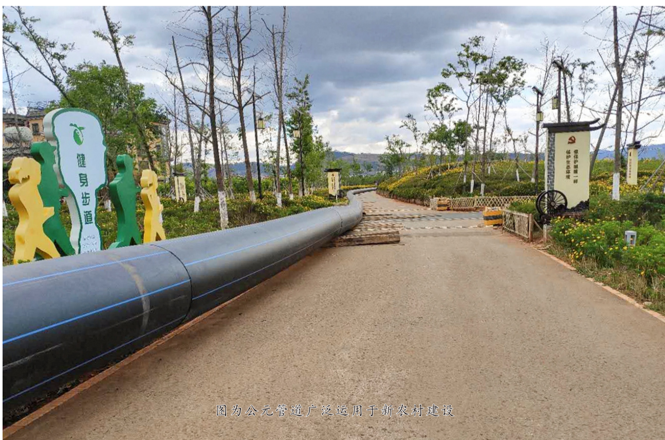
图为公元管道广泛运用于新农村建设