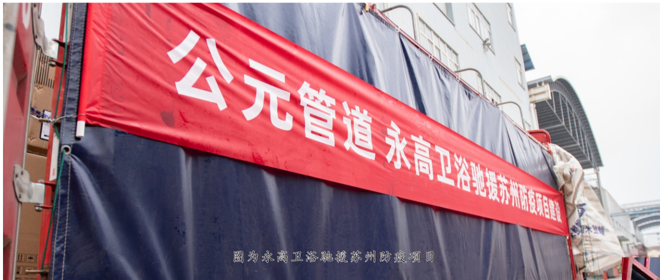
图为永高卫浴驰援苏州防疫项目

据了解，苏州新冠疫情防控形势严峻，截止2月21日凌晨，累计报告确诊病例201例，无症状感染者24例。公元在了解到苏州相城区北桥街道大师谷疫情隔离点建设急需一批马桶后，永高卫浴事业部主动与当地相关部门联系，在接到相关部门的认可及应急需求后，立刻筹备相应物资并在第一时间发出，最终在2月23日凌晨顺利到达并投入建设。