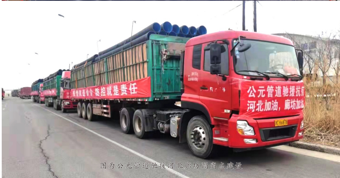
图为公元管道驰援河北廊坊隔离点建设