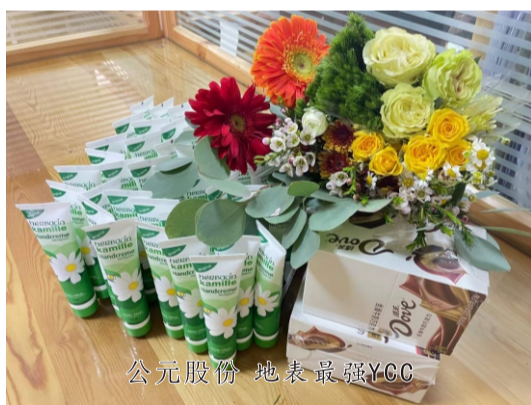
公元股份 地表最强YCC