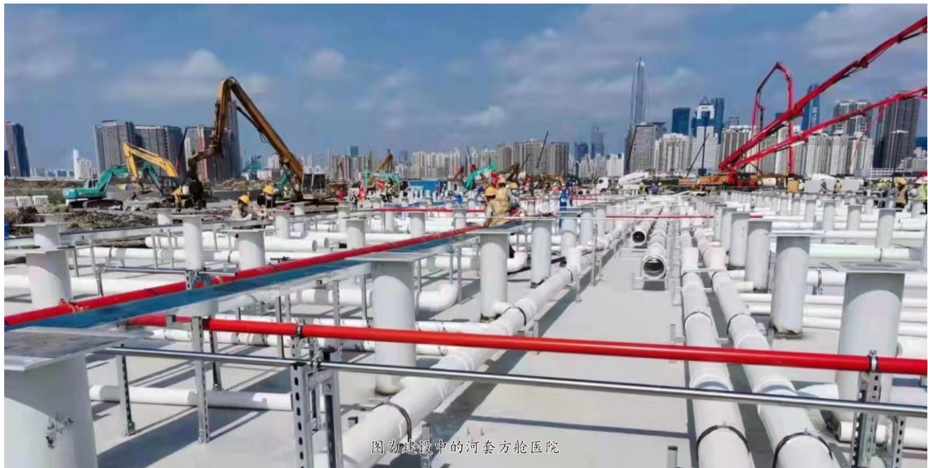
图为建设中的河套方舱医院