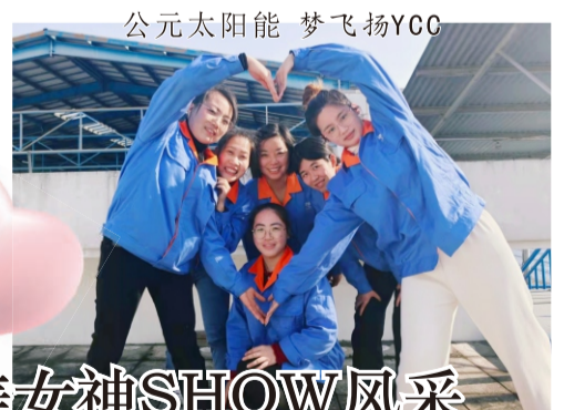
公元太阳能 梦飞扬YCC

姑娘们期盼已久的女神节终于到啦！朋友圈的伙伴们为勤劳善良的女性圈员送上公司和圈委们准备的精美礼品和节日的祝福。并在活动中设置抽奖环节，意外的是中得大奖的居然都是男神们，瞧他们开心的模样！朋友圈的圈委还想对所有女圈员说：“你不一定是谁的公主，但一定是自己的女王，愿你眼里总有光芒，手中总有鲜花，愿你成为自己的太阳。”祝所有男神、女神都快乐！