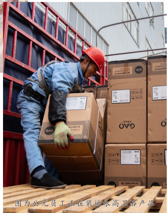
图为公元员工正在装运永高卫浴产品