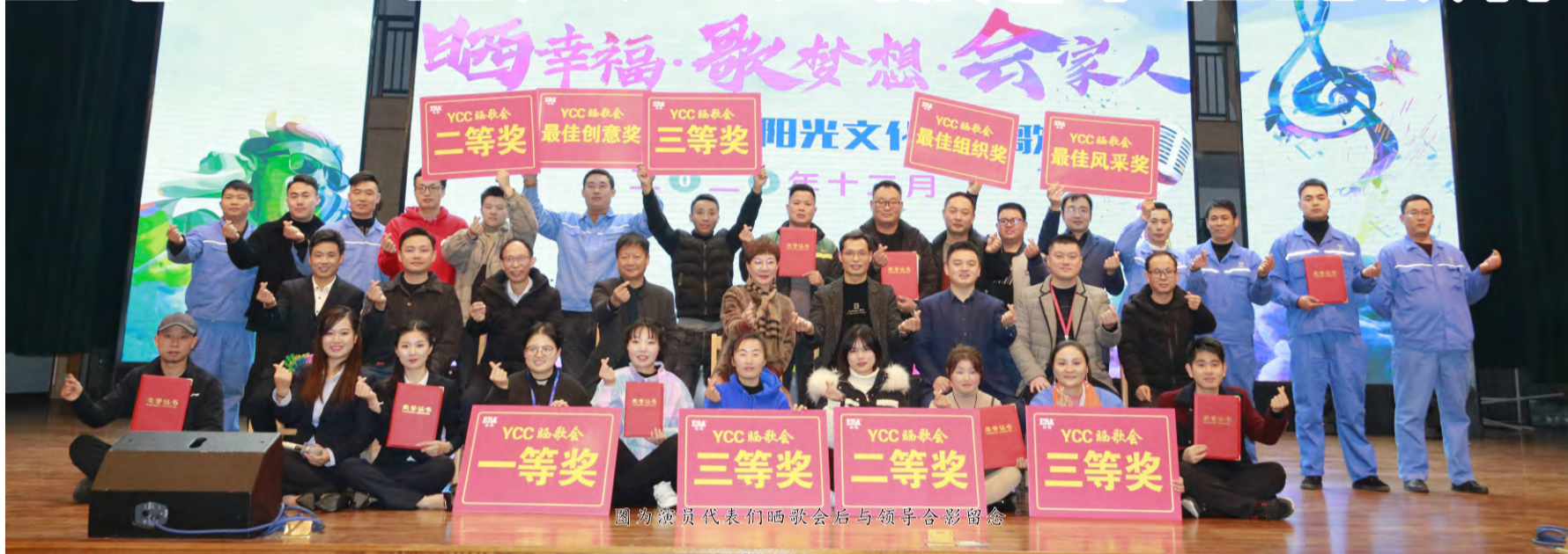
图为演员代表们晒歌会后与领导合影留念

本报讯（通讯员 彭 频）12月7日，恰逢二十四节气中的大雪，广德冬雨飞扬，冷风漫舞，路上难觅人影，但安徽永高的多功能厅内却灯火通明，热闹非凡。安徽永高正在举办盛大的“晒歌会”，掀起了一场全员狂欢的视听盛宴。