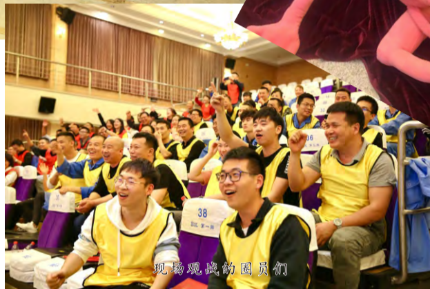
现场观战的网友们