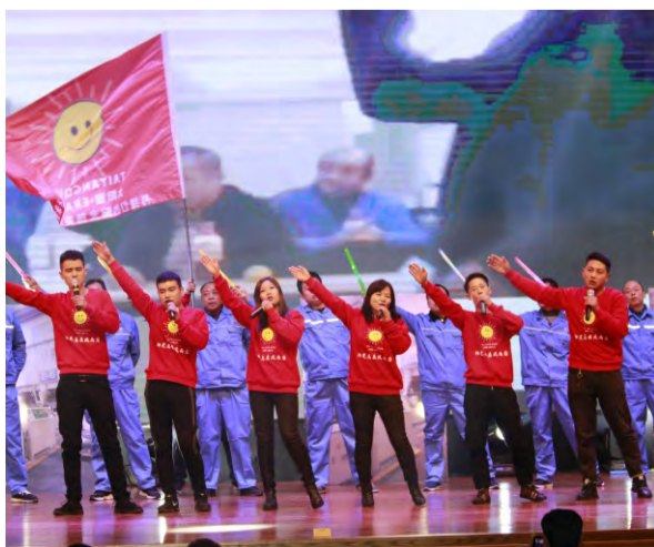
太阳圈《阳光总在风雨后》