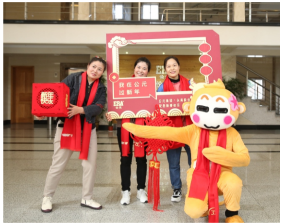
图为YCC团员参加“我在公元过大年”合影活动