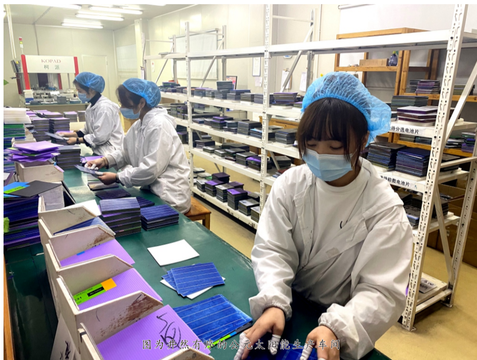
图为井然有序的公元太阳能生产车间

“节前大保养”的开展,确保了开工后设备第一时间投入生产。以公司生产主力军之一的双浦厂区为例,在开工第一天,双浦厂区便有44条挤出线,243台注塑机投入到紧张的生产之中,开机率达70%。为了避免员工因假期而导致的安全心理松懈等情况,重点强调生产安全问题。对于刚入职的新员工,厂区第一时间组织安全培训,且利用YCC文化圈里面的关爱委员进行专项辅导介绍,在思想上树立安全意识。