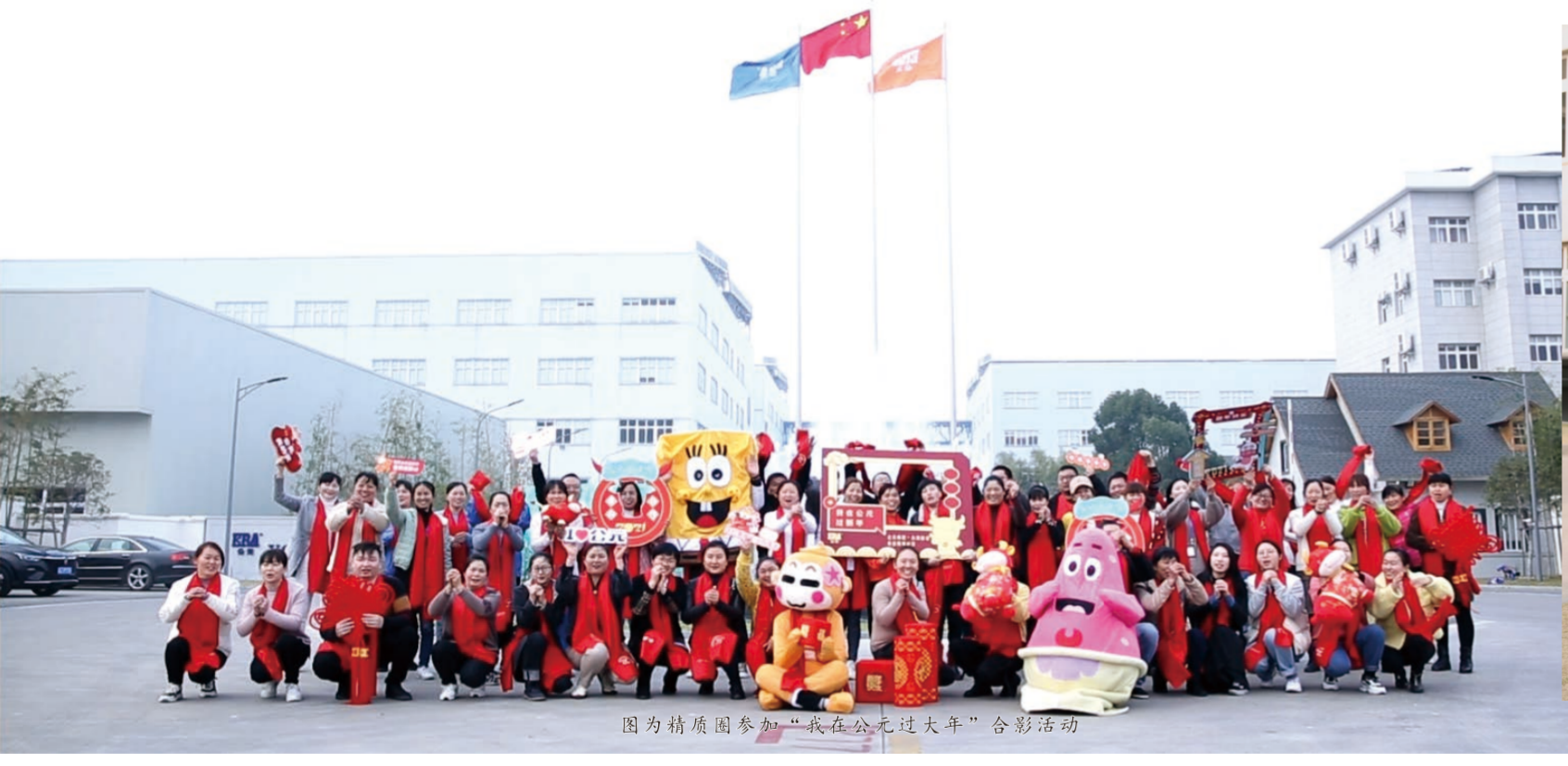
图为精质园参加“我在公元过大年”合影活动

欢度佳节人聚首 流连往返笑语长 庆新年 人欢闹 家家户户贴春桃 舞长卷 贴烟花 城城墙墙点鞭炮 噹噹火灼灼 曜曜眼 眼含喜光激滂 瓜果蔬花齐上场 童颜乐活心飞扬 闹辛丑 烟花灿九天 庆诞辰 置酒撒飞雪 渝寒松 月晕染年华 乾坤纳堂 堂暖天下 门迎百福 梅映窗花 寒随宵尽 愁与梦消 春伴燕来 情参江暖 守华年 致远中华 抗重疫 情怀天下 赏杯莫停 风送喜 晓鸣声醒 香漫意 士心不忘 国永存 年情入帐 少年强