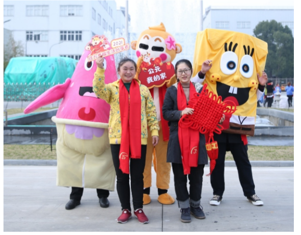
图为YCC团员参加“我在公元过大年”合影活动