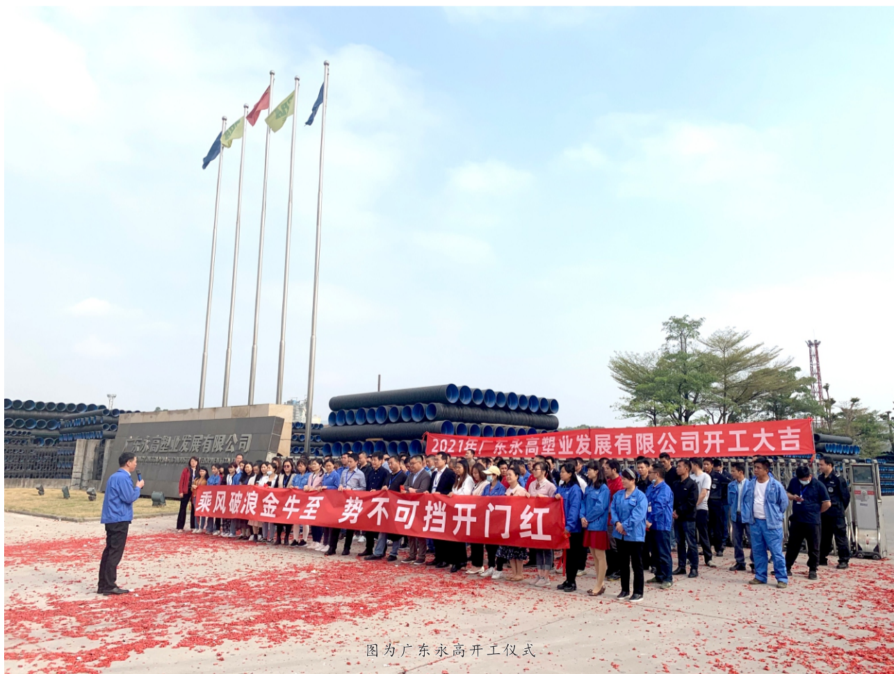
图为广东永高开工仪式

为了迅速恢复生产经营,公司各个部门配合联动,形成工作合力。安徽永高内部管理部门组成培训师团队,分别为新入职的员工开场不同岗位技能的培训,加速新员工熟悉岗位工作内容,助力公司复工复产。