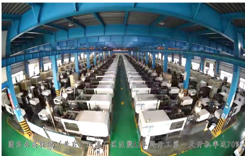
图为永高股份(黄岩)双浦厂区注塑A2车间开工第一天开机率达70%

据了解,公元太阳能目前生产处于满负荷运转,太阳能灯具,黄岩厂区10条线和安徽厂区3条线,订单已排到六月份,预计3月份产量超过130万盏;太阳能组件,1条手动线+2条自动线两班运转,预计3月份产量超过25MW。