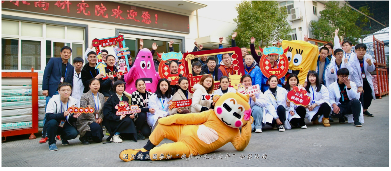
图为精质园参加“我在公元过大年”合影活动

清冷的早晨被一阵敲门声打破，开门时依稀看见他们都带着手套，或许还有晨雾粘在他们的发梢，开门的瞬间微微的寒意渗进来。可他们是热情的，语调里激昂着新年的快乐，他们没有开灯，只是暖洋洋的跟我说，新年快乐！活泼的语调似是能驱散一整个冬天的寒冷。就在那一刻，敲门的那一刻，我的春节似乎被点燃了，也正如他们所说的，晚上公司也准备了活动，其他的同事也呼唤着我，楼下健身房里的音乐热闹而美妙。哪怕此时的我没有在家，却也不再孤单。因为他们陪伴我在公元的家庭里彼此相拥，彼此温暖。 春时不负，幸得有你。