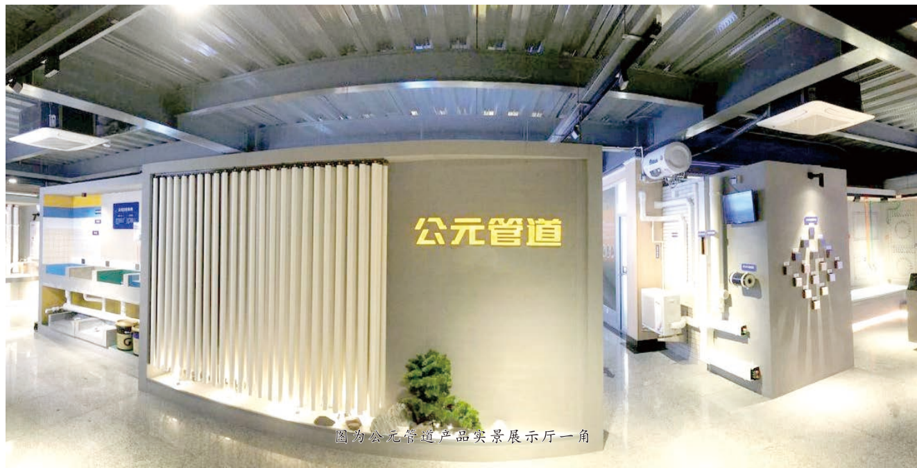
图为公元管道产品实景展示厅一角

筑给水系统、双立管排水系统、市政埋地排污排水、PVC-U结构拉缝板等多个公元产品系列。该展示厅，不仅对客户开放，为客户提供沉浸式体验，还将有助于公元铁军的产品知识实地学习。