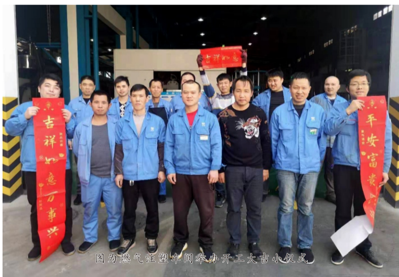
图为燃气注塑车间举办开工大吉小仪式