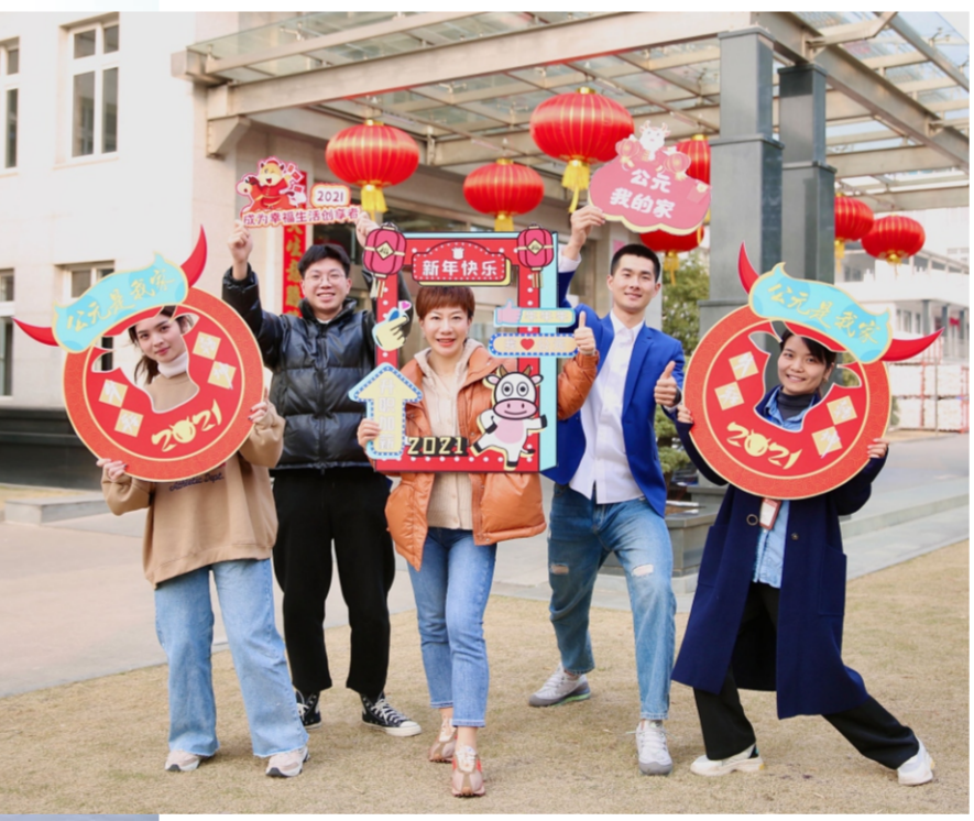
图为YCC团员参加“我在公元过大年”合影活动